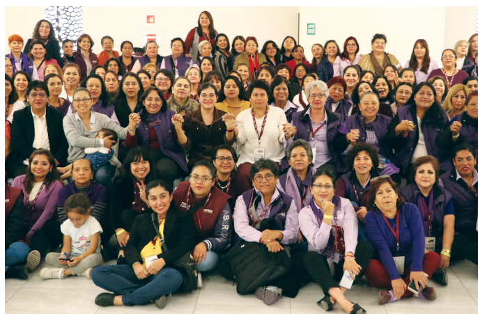
Mujeres morena , evento Encuentro Nacional de Mujeres, Puebla, 16 y 17 de noviembre, 2019.