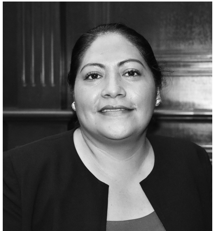
Zenaida Salvador Brígido, 2019.

Diputada local por el municipio de Zitácuaro en Congreso del Estado de Michoacán. Integrante de las comisiones de Salud y Asistencia Social y de Igualdad de Género